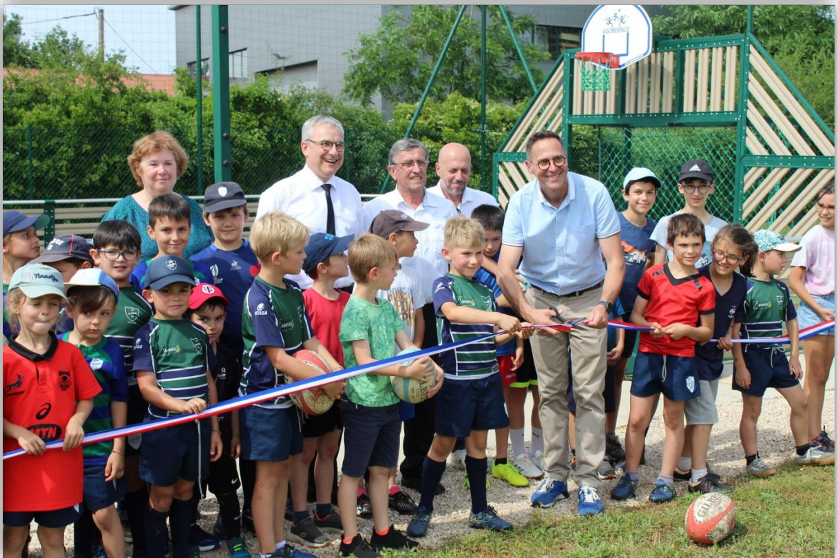
Photo : Inauguration City Stade 14/06/2025